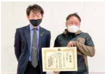
栃法連青年部会連絡協議会役員会

今回は意見交換の場を設け、各地青年部会の近況報告や問題点などをフラットな形で行いました。コロナ禍でなかなか積極的な事業ができないのは仕方がないところですが、会員増強には色々な方法や対策をしながら運営していることが分かります。各青年部会でも建設的に検討していこうと情報共有で一致しました。